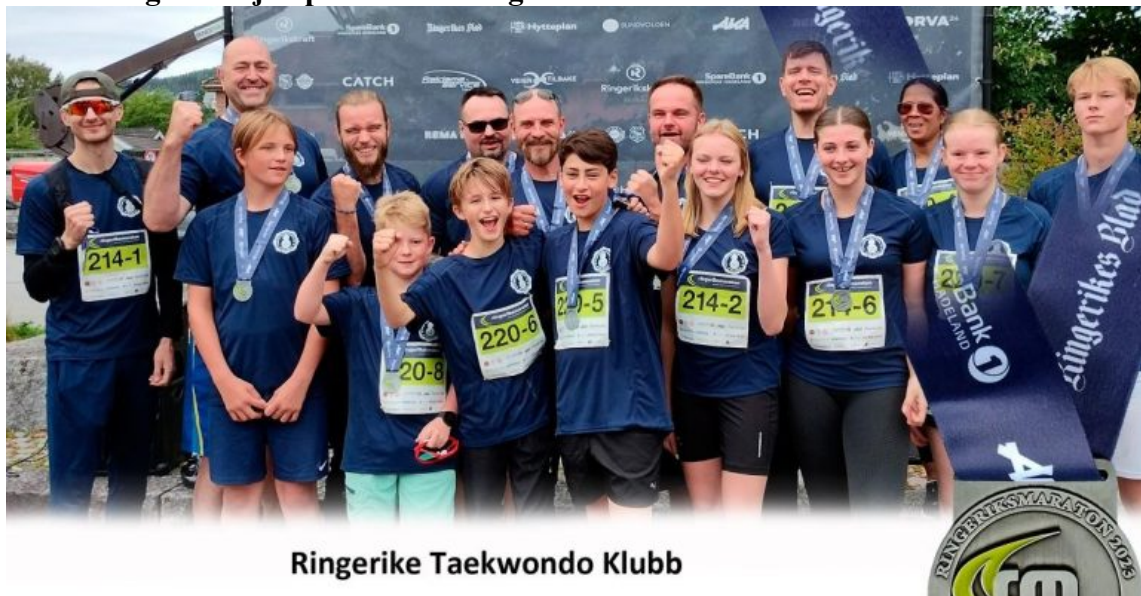
Ringerike Taekwondo Klubb

I år igjen var klubben godt representert, med to lag på Ringeriksmaraton! I år klarte vi å stille to fulle lag, uten at noen måtte løpe dobbelt eller med flere stafettpinner, som jo må regnes som en stor suksess. I tabellen ser du lagene.